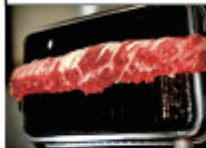
はみ出たけハラミ