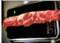
はみ出たけハラミ