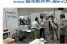
本日の出展されたらる会場「感染症総合展」の様子