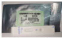
新型コロナウイルス判定器