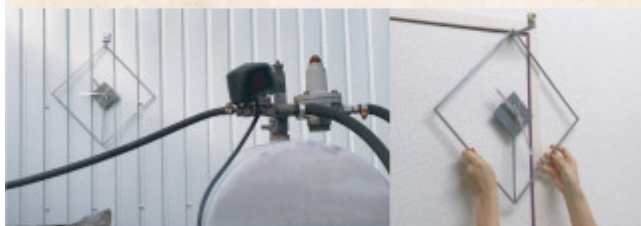
場所を選ばない。時計のディスプレイの概念を変える「ひっ掛ける」時計