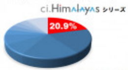
■2018年度「BISパッケージ出荷金額シェア」