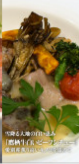
雪降る大衆の白い湯呑み 「恵納牛たんビーフシチュー」 発祥地恵納のふいもんセンター