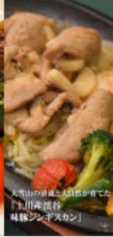
大雪山の頂上と大団圓が育めた 「旭川市 恵納 味噌ジンゴアスカシ」