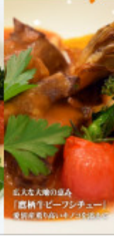
巨大な大衆の湯呑み 「恵納牛たんビーフシチュー」 発祥地恵納のふいもんセンター