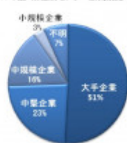
■2017年度「業種別センター数構成比率」*2

*2 大手企業:年間50億円以上 中堅企業:年間30億円以上50億円未満 中規模企業:年間10億円以上30億円未満 小規模企業:年間1億円未満