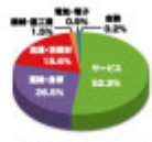
■ 2016年度「Himalayas」の国際会議シェアの構成比率（1）

※1ターニクス（4国、仏、ロシアに代り、韓国・台湾）：東京（カンファレンス） ※2ターニクス（中東 300名以上）：中国（北京）：東京（2泊 3泊以上）500名以上 ※3ターニクス（南米 100名以上）50名以内、中国（北京）：東京（1泊）50名 ※4国（東京）：3ターニクス（東京）開催数（2017年1月31日現在）