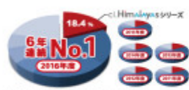
■ 2016年度「Himalayas」の国際会議シェア

※Himalayasの国際会議（カンファレンス、ワークショップ） ※会場：東京のヒルトンホテルや京都のヒルトン ※アジアの各都市にホテルを有する ※特別価格パッケージ（2泊4日）の開催（2017年開催）