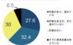
<事業承継を進めるための計画有無>