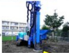
開発した技術（3m掘削時） 残土が出ない！